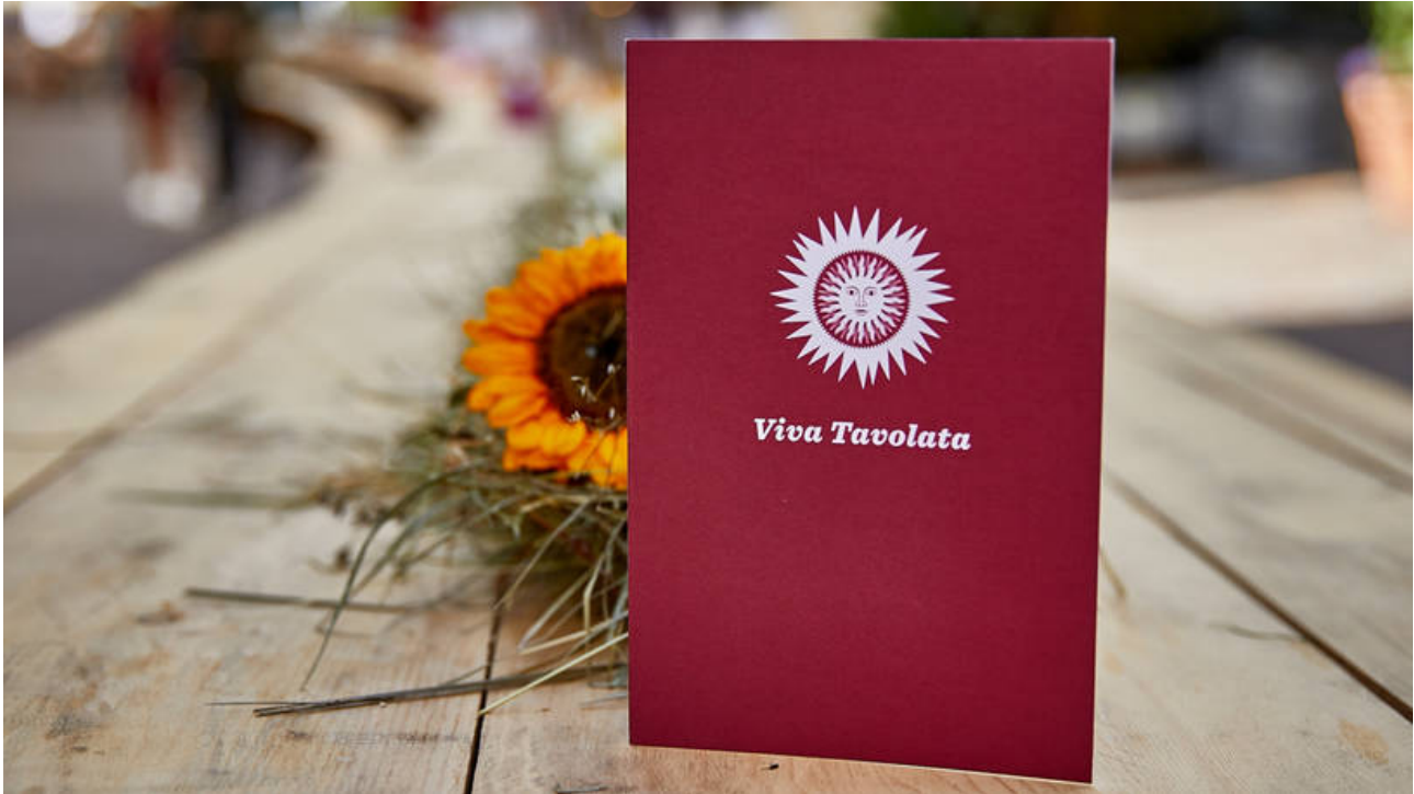
Ein Jubiläumsjahr: Zum zehnten Mal findet die Tavolata St. Moritz statt.