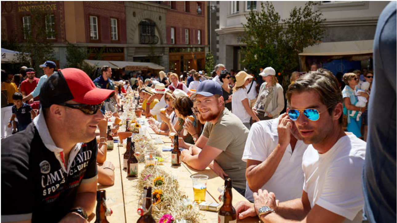
Geselligkeit erleben: Der Anlass bringt jedes Jahr Gäste aus aller Welt und Einheimische zusammen.